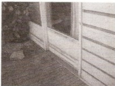
Generelt manglende malerarbejde.