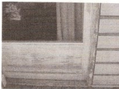
Skydedør bør males snarest.