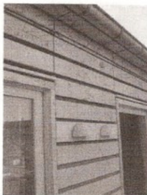
Beklædning bør males.