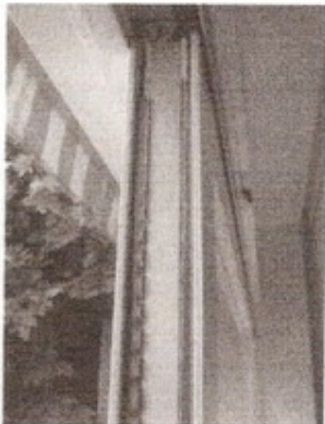
Gummiliste går ikke helt op.