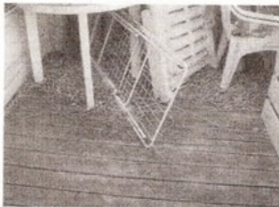
Blade bør fjernes, så afløb ikke tilstoppes.